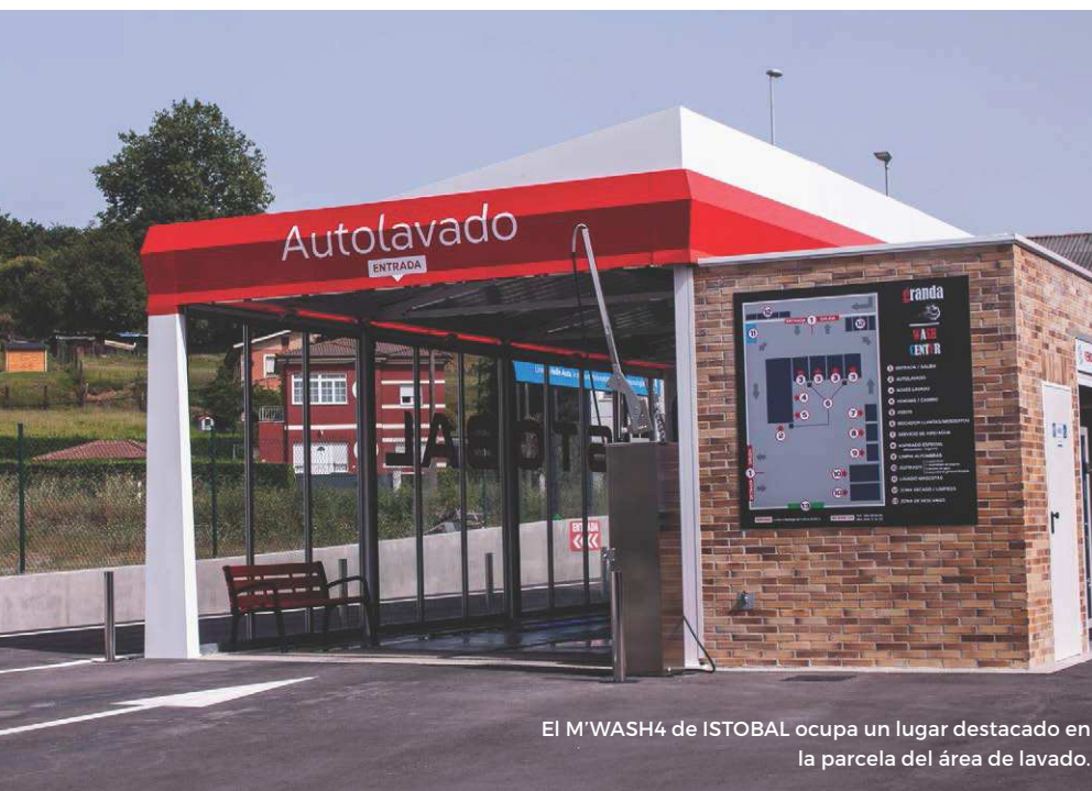
El M'WASH4 de ISTOBAL ocupa un lugar destacado en la parcela del área de lavado.

Otra ventaja añadida es que, al estar conectados a internet, cualquier problema o incidencia que sufra cualquier