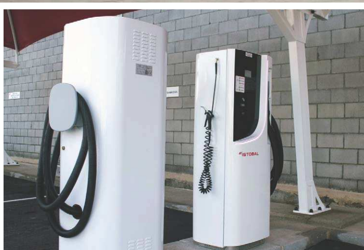
Los clientes tienen a su disposición cinco aspiradores polvo IOT de la multinacional española.

equipo se aborda de forma remota al momento, ofreciendo así una mayor cobertura al propietario del área de lavado. Otro ejemplo de la digitalización que protagoniza ISTOBAL es que sus más recientes aspiradores (y también los boxes) cuentan con un modo en espera, durante el cual no se consume ni tiempo ni saldo, una característica que permite al usuario final pausar el aspirado o el lavado a presión para aprovechar al máximo el tiempo y rentabilizar el servicio, pagando solo por el uso realizado.